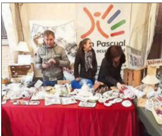
Al carrer Santa Rita es van situar els stands de les associacions locals