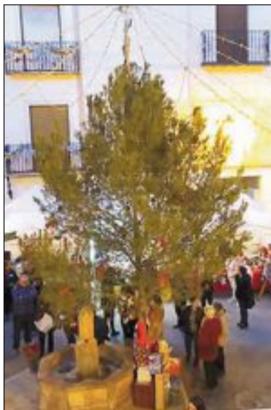
Este año, el Ayuntamiento se ha encargado de la organización de la Fira de Navidad, aportando las carpas de los expositores y organizando actividades

Aunque la climatología no fue muy favorable, la feria contó con buena afluencia de visitantes y "hemos recogido muchas Pero estem contents, hem recabat millores per al proxím any, i aquest any hem fet un discurs nadalenc per al ences de les llums de nadal (no som madrid, pero com si ho forem)