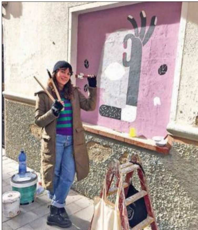
Per segon any, es realitzarà el projecte Finestres Obertes , des del 19 al 23 de desembre, per a cobrir amb murals les finestres i portes tapiades del nucli antic