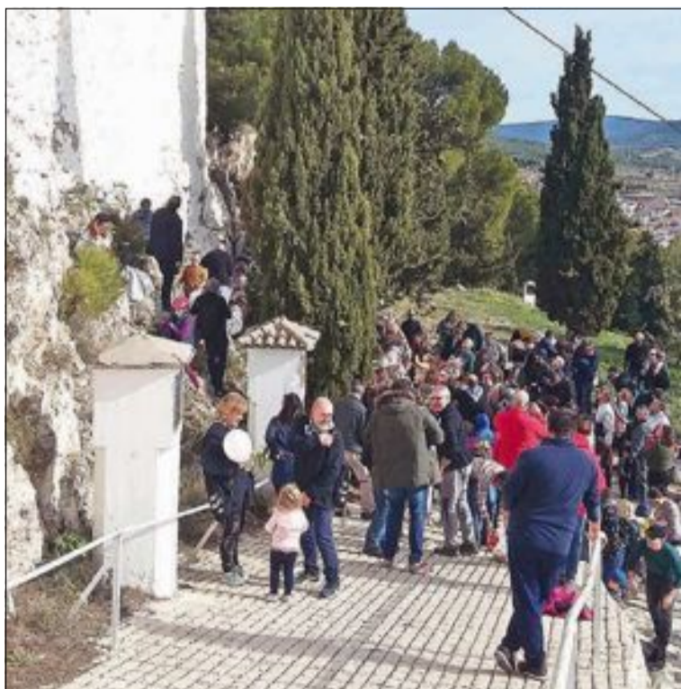
Bateig de Santa Llúcia, el dissabte 14 de desembre