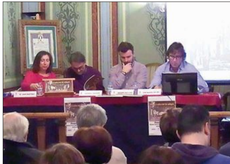
Presentación del libro Plazas y calles del Ibi antiguo , el pasado 29 de noviembre

El crecimiento, sin ser muy cuantioso, resulta especialmente apreciable teniendo en cuenta que se trata del quinto aumento anual consecutivo, una grata noticia para lo amantes del papel y para todo el sector editorial en España.