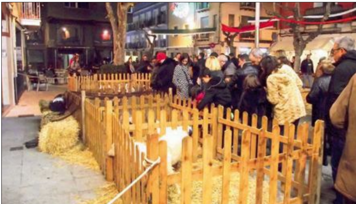
Els animals de granja de la plaça de la Palla van ser molt visitats

El Museu del Joguet ha comptabilitzat 1.200 visites i el de la Biodiversitat, més de 600.